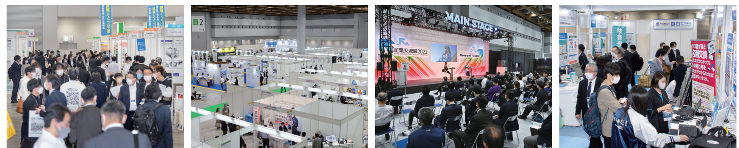
産業交流展2022の様子